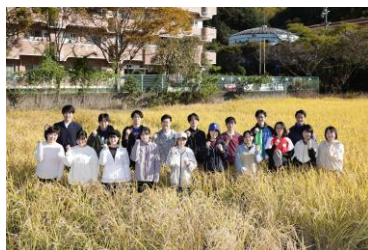
社内報（SDGs 推進レポート） 新入社員お米づくり研修

当社は今後も、持続可能な地球社会の実現に向け、SDGs 推進に関する取組を継続してまいります。